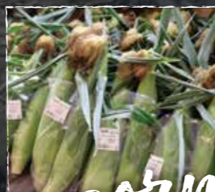
白いとうもろこしや 白と黄色のミックス品種に 出会うかも…!