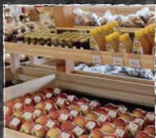
お土産が大体揃います◎

キャベツ、とうもろこし、トマト、 花豆、鎌原きゅうり、果物、雑貨、 地元の多品目野菜、加工食品等